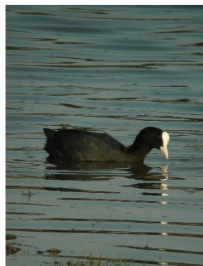
Foulque macroule - LPO Anjou