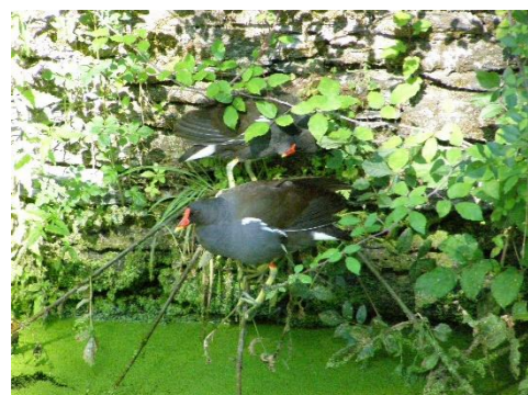
Gallinule poule-d'eau